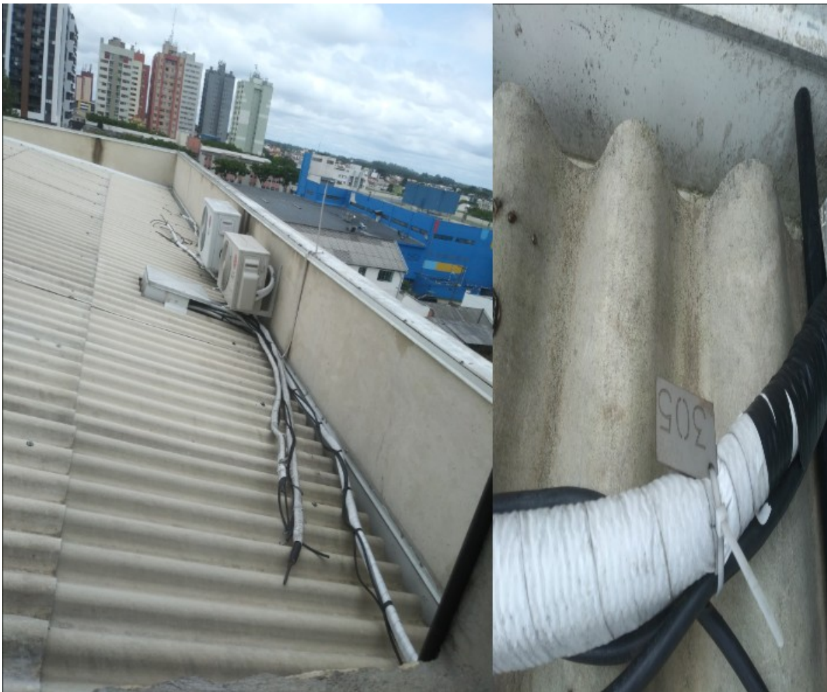
Figura 3 - Local de Instalação da Condensadora do Aparelho de Ar Condicionado com preparação.

5.6. A contratada deverá realizar um reforço nas paredes de Dryall próximo as caixas de passagem Split para melhor fixação das unidades evaporadoras.