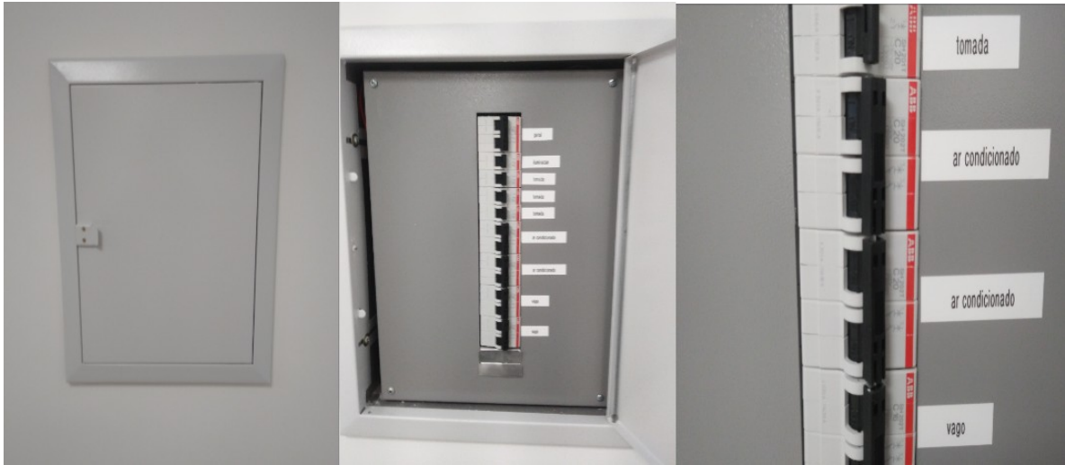
Figura 2 - Quadro elétrico com os disjuntores dos respectivos aparelhos de ar condicionados a serem instalados

5.4. A distância vertical estimada entre as evaporadoras e as condensadoras é de aproximadamente 20 metros.